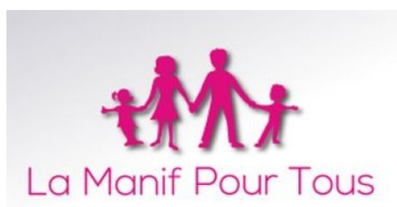
Figure 1. Logo du mouvement « La Manif pour tous »

Pendant la controverse elle-même, et en particulier dans les manifestations, la « Manif pour tous » s'est appuyée sur une représentation de la famille constituée d'un père, d'une mère et de deux enfants, un garçon et une fille, représentation qui s'est incarnée dans le logo du mouvement (cf. Fig.1). Ce modèle s'est vu renforcé dans les manifestations par l'usage du rose et du bleu, les couleurs marquant traditionnellement la différenciation des genres.